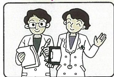
地域の訪問看護ステーション